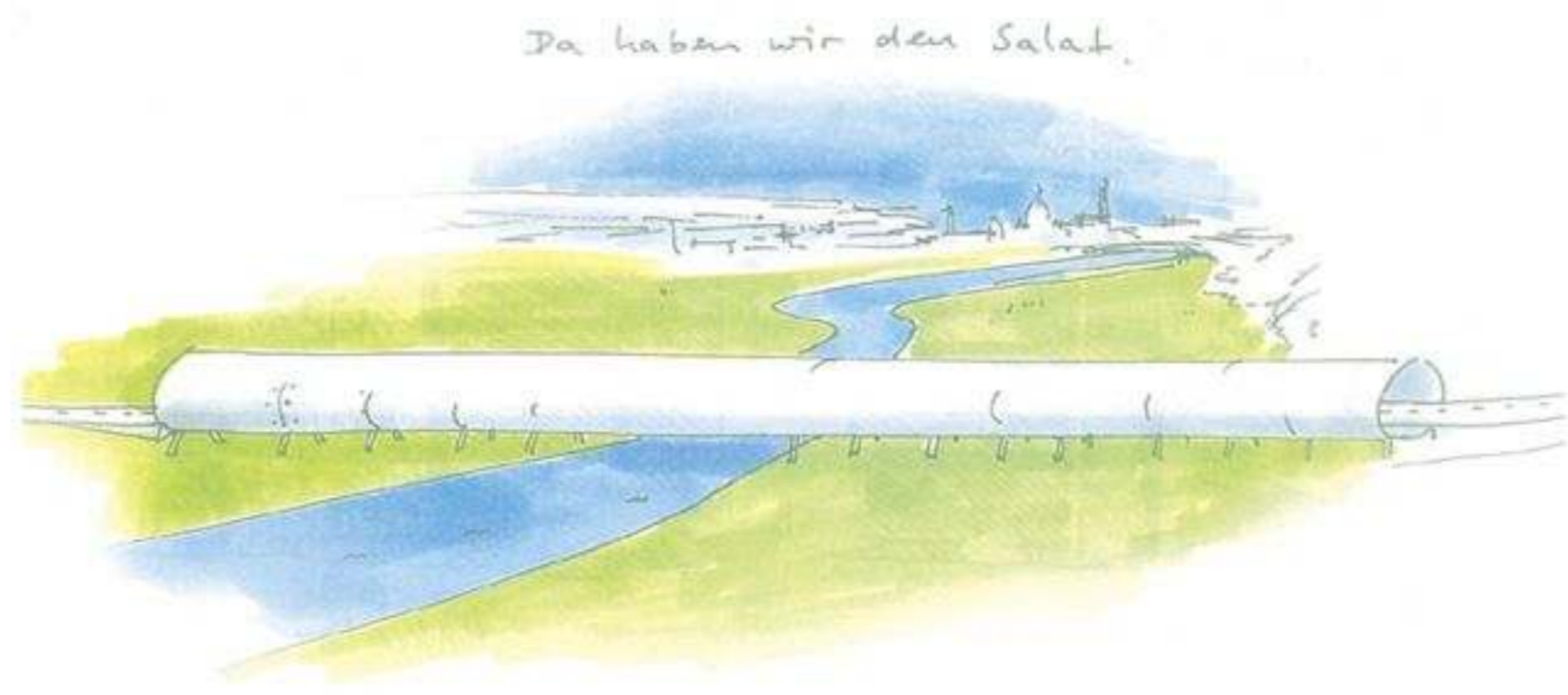
2009: Bürgerbegehren für Tunnel erfolgreich.