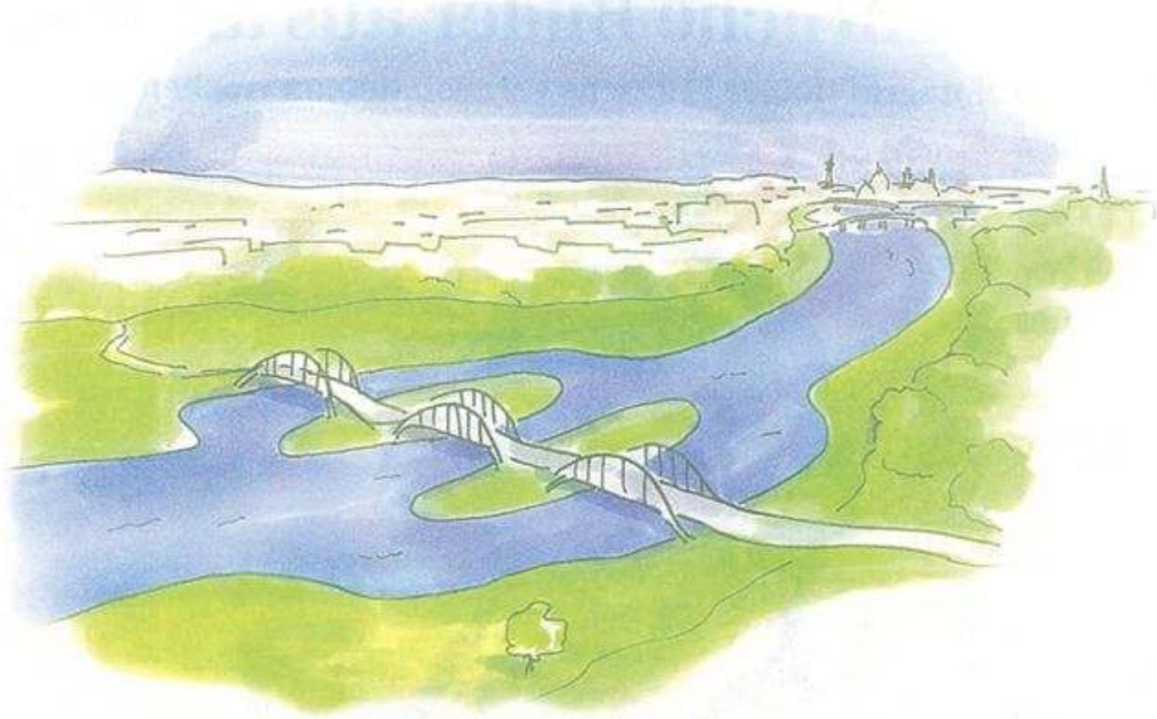
für das Geld hätte man auch drei kleinere Brücken bauen können