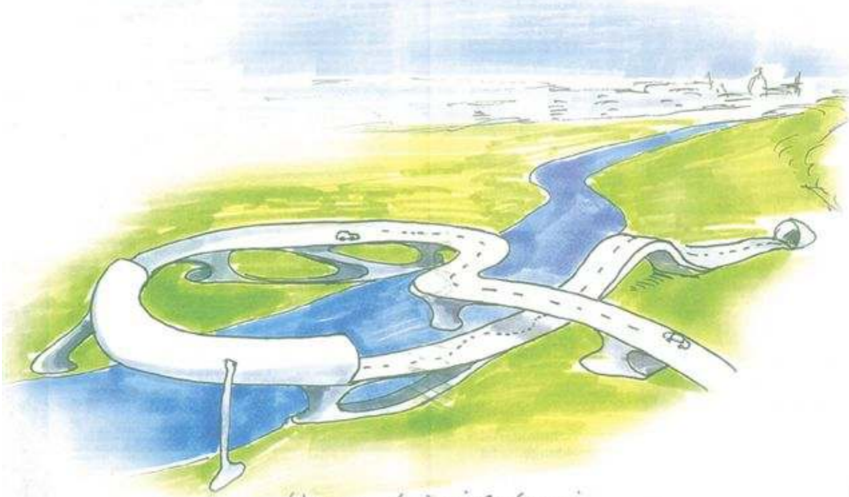
Wenn Luigi Colani die Brücke entworfen hätte.