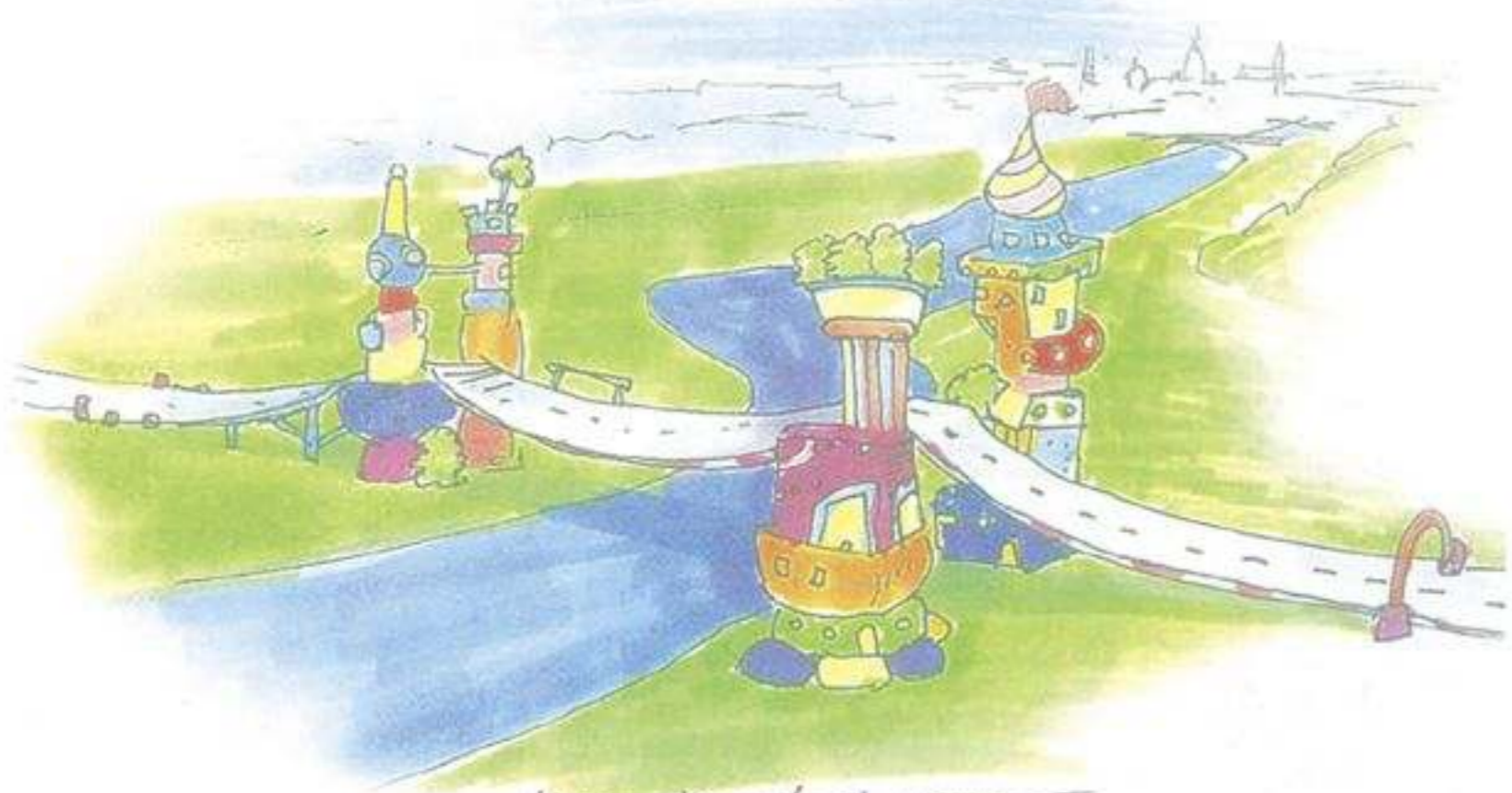
Wenn Hundertwasser die Brücke entworfen hätte.